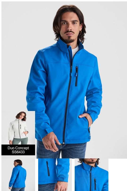
Duo Concept SS6433