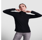
Duo Concept SM1096