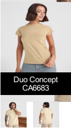
Duo Concept CA6683