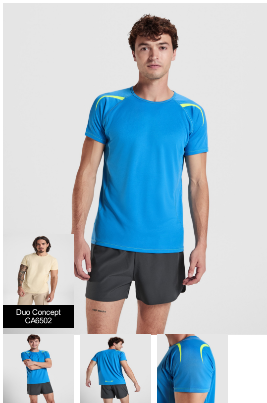
Duo Concept CA6502