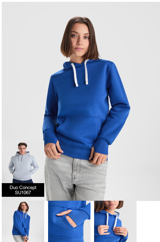
Duo Concept SU1067